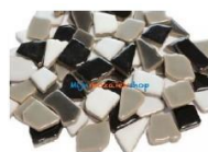
Mix WIT TOT ZWART