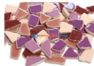
Mix WILDE BLOEMEN